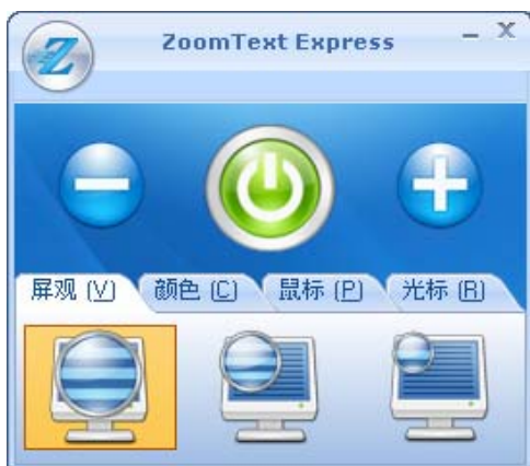
ZoomText Express 用户界面

当 ZoomText Express 启动后, 它将改变屏幕显示并将正常屏幕加以放大. 当你移动鼠标, 键入文字或者在各项程序中游历时, 放大的屏观自动移动, 并保持你看到你所进行的活动. ZoomText Express 用户界面也显示在屏幕上.