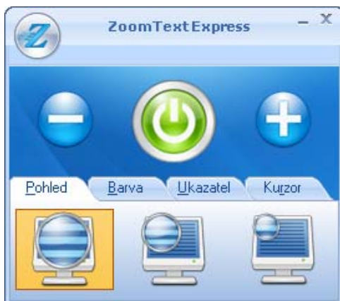
Uživatelské rozhraní ZoomText Express

Po startu ZoomText Express změní vzhled obrazovky, uvidíte ji ve zvětšeném pohledu. Při pohybu myši, psaní textu nebo navigování v aplikaci zvětšený pohled automaticky roluje, takže aktivní oblast se stále drží ve zvětšeném pohledu. Na obrazovce se také objevuje uživatelské rozhraní ZoomText Express.