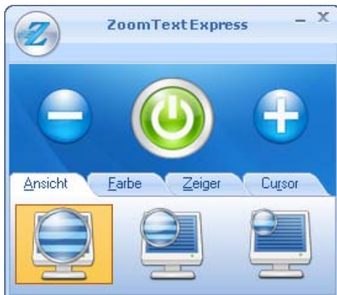
Benutzeroberfläche von ZoomText Express

Wenn ZoomText Express startet, verändert es Ihren Bildschirm und zeigt eine vergrößerte Ansicht des normalen Bildschirms. Sobald Sie die Maus bewegen, einen Text eintippen und innerhalb Ihrer Anwendung navigieren, scrollt die vergrößerte Ansicht automatisch, um den Bereich der Benutzeraktivität im Blickfeld zu halten. Die Benutzeroberfläche von ZoomText Express erscheint ebenfalls auf dem Bildschirm.