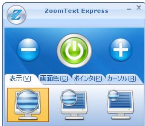
ZoomText Express ユーザー インターフェイス

ZoomText Express を起動すると、標準画面が拡大表示されます。マウスの移動、テキスト入力、およびアプリケーションの操作を行うと、拡大画面が自動的にスクロールされ、アクティブな領域が常に表示されます。また、画面に ZoomText Express ユーザー インターフェイスも表示されます。