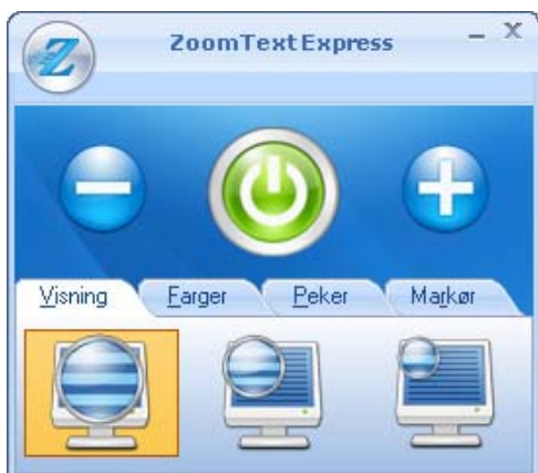
ZoomText Express brukergrensesnitt

Når ZoomText Express starter opp, endres skjermbildet til å vise et forstørret bilde av den normale skjermen. Når du beveger musen, skriv inn tekst og navigere i programmene dine, vil det forstørrede bilde automatisk ruller og holde det aktive området i fokus. ZoomText Express brukergrensesnitt visse også på skjermen.