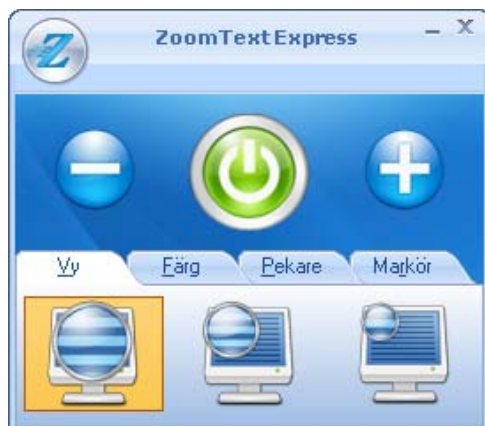
ZoomText Express Gränssnitt

När ZoomText Express startar startas även förstoringen. När du skriver, flyttar musen eller navigerar kommer förstoringen följa efter ZoomText Express programfönster visas också på skärmen.